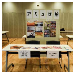
ブースのイメージ